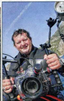
Le photographe en action.