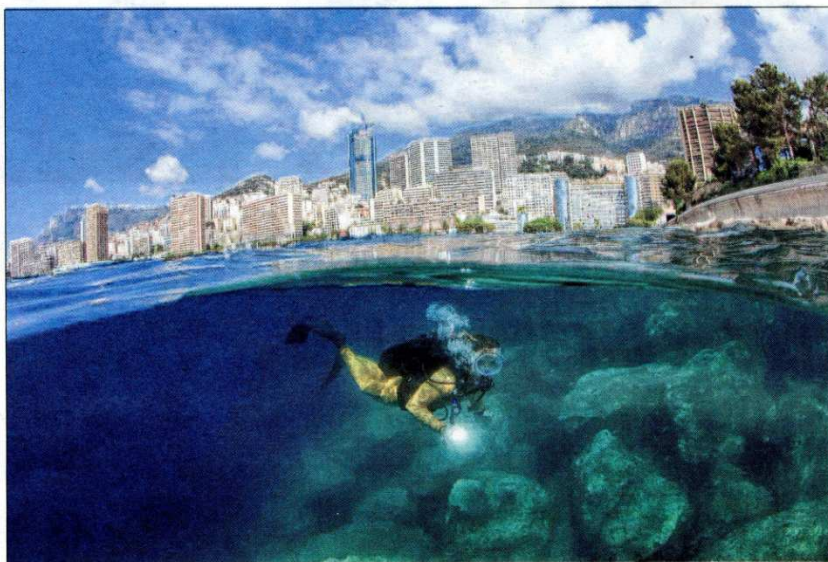
Sous le Sporting d'été (à droite) et les immeubles du Larvotto (à gauche).

Cette technique photographique complexe consiste tout d'abord à positionner son objectif super grand angle (fish eye) sur une horizontale parfaite pour rendre sur une