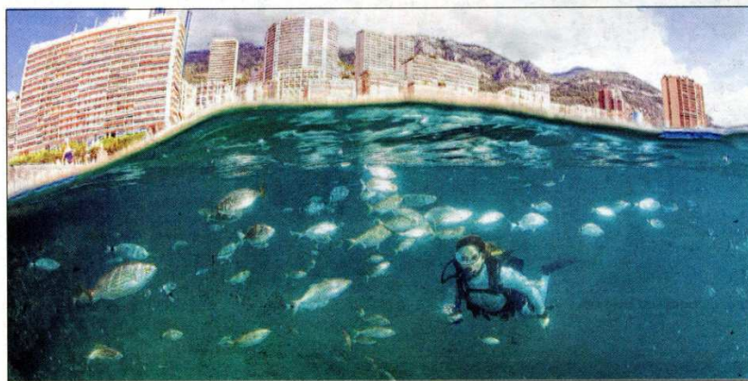
Le Larvotto et sa réserve regorgent de poissons.